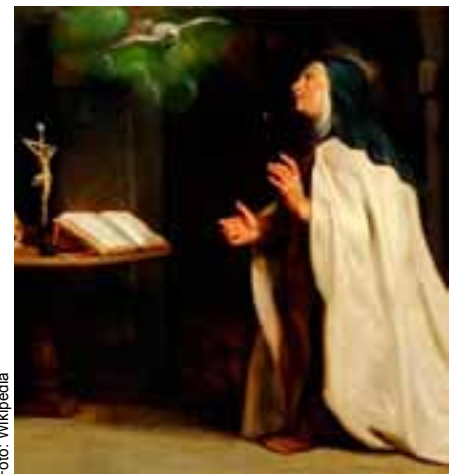
Gemälde von Peter Paul Rubens (1577 - 1640)

Der Dreieinigkeit werden Rot, Blau und Grün zugeordnet: Rot ist Gottvater, Blau Gottes Sohn und die Farbe des Heiligen Geistes ist Grün . Oft wird er bildlich als weiße Taube auf grünem Hintergrund dargestellt.